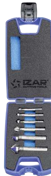
Set 6 Pcs