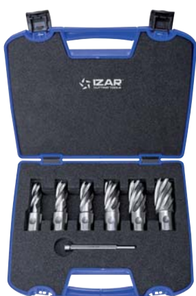
Set 6 Pcs